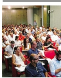
Corso di formazione di Skille Comuni

Il corso è gratuito, basta iscriversi a info@comuni.skille.it .