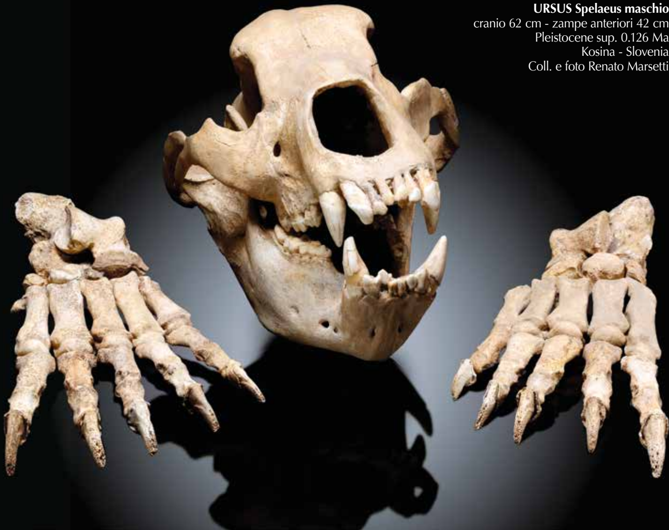
URSUS Spelaeus maschio cranio 62 cm - zampe anteriori 42 cm Pleistocene sup. 0.126 Ma Kosina - Slovenia