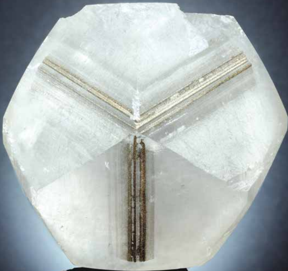
CALCITE con inclusione di Pirite stellata cristallo 12.5 x 12.5 cm Chenzhou Mine - Hunan - Cina