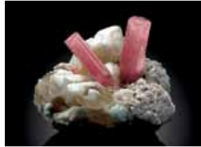
TORMALINA var. Elbaite con Quarzo, Lepidolite e Zircono

ELBAITE ROSA VARIETA' PREZIOSA DELLE TORMALINE. L'Isola d'Elba racchiude in sé il fascino e l'esclusiva di un territorio ricco di natura, di storia e di civiltà. E' grazie alla sua conformazione geologica e alla sua particolare posizione geografica che quest'isola è considerata un laboratorio a cielo aperto per i geologi. In questo meraviglioso territorio, all'inizio del secolo scorso (Vladimir Wernasky 1913) è stata rinvenuta l'Elbaite rosa nel cuore della montagna dell'Isola d'Elba, dalla quale prende il nome. L'Elbaite rosa rappresenta la varietà più famosa del gruppo delle Tormaline ed è un cristallo di eccezionale bellezza e rarità. Il minerale si trova nei filoni pegmatitici e si presenta in cristalli prismatici di viva lucentezza. Questa gemma è considerata preziosa a pari merito degli Smeraldi, Rubini e Zaffiri. L'Elbaite rosa dell'Isola d'Elba è esposta nei più importanti musei mineralogici del mondo (New York, Parigi, Londra, Mosca ecc.). Questi meravigliosi cristalli gemmologici sono raffigurati in copertina, nella ricorrenza per il quindicesimo anniversario del calendario Ecogeo Srl di Bergamo.